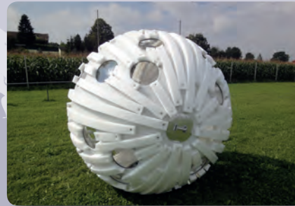
First prototype Erster Prototyp

Der „ gesellige Urlauber “: er bevorzugt entspannende und sportlich wenig herausfordernde Aktivitäten, ist etwas älter und wird sich von der Möglichkeit eines wunderbaren Rundumblicks sowie einer klaren Sicht unter Wasser überzeugen lassen.